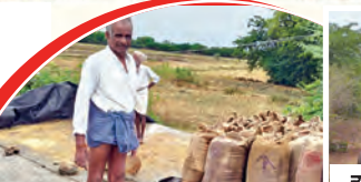
తడిసిన ధాన్యాన్ని ఆరికెట్టుకుంటున్న రైతు