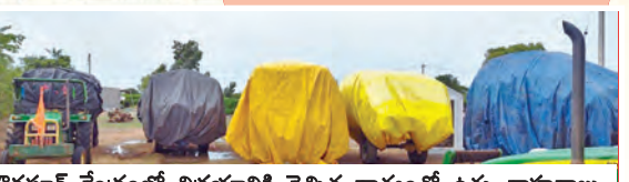
వోడపూర్ కేంద్రంలో విక్రయానికి తెచ్చిన ధాన్యంతో ఉన్న వాహనాలు

వందల టన్నుల వరి ధాన్యాన్ని అకాల వర్షంతో తడిసిపోతున్న దిగుబడి తో సాగి వందలకంటే కొనుగోలు, ధాన్యం నిల్వలపై అయోమయ పరిస్థితి ఏర్పడింది. రైతులు వెనుకబడి, పెట్టుబడి పెట్టి వేరుపడిన ధాన్యం అమ్ముకోవడానికి అడ్డంకులు వస్తున్నాయి. తడిసిన ధాన్యాన్ని ఆరికెట్టుకుంటున్న రైతులకు తప్పని ఎదురుచూపులు అవుతున్నాయి. తేమ, తరుగు పేరుతో పది కిలోలు కొత అవుతున్నాయి. తడిసిన ధాన్యాన్ని ఆరికెట్టుకుంటున్న రైతులకు తప్పని ఎదురుచూపులు అవుతున్నాయి. తేమ, తరుగు పేరుతో పది కిలోలు కొత అవుతున్నాయి.