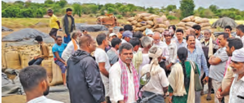
రైతుల ఆవేదనకు స్పందించి పంటలూపాటిన జనగాం కొనుగోలు కేంద్రంలో సమన్వయ చేయాలని రైతులు కోరారు

బ్యాగులు ఇవ్వకపోవడంతో తీవ్ర ఇబ్బందులు పడుతున్నామన్నారు. ఇటు గన్నీ బ్యాగులు, అటు లాల్లీలు లేక ధాన్యం కేంద్రాల్లోనే ఉండిపోవడంతో రాత్రి కురిసిన వర్షానికి పంట అంతా తడిసి ముద్దయిందని వాపోయారు. "ధాన్యాన్ని ఎండబెట్టి తెచ్చినా, అధికారుల నిరక్ష కురిసిన వర్షానికి తడిసిపోయింది. దీనికి ఎవర బాధ్యత వహిస్తారు? ఓ పక్క తేమ, తరుగు అంటూ కొర్రలు పెడుతూ తూకంలో మోసాలకు పాల్పడుతున్నార" అని రైతులు ఏకరువు పెట్టారు. రంగారెడ్డి అధికారులు.. రైతులు దాదాపు గంటపాటు రాస్తారోకో చేయడంతో వాహనాల రాకపోకలకు