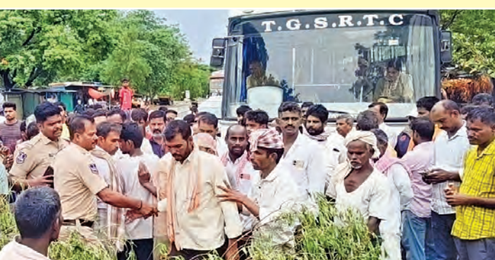
వెళ్లమల్ మండలం మంబాపూర్ వద్ద రాస్తారోకో నిర్వహిస్తున్న జనగాం రైతులు

బ్యాగులు ఇవ్వకపోవడంతో తీవ్ర ఇబ్బందులు పడుతున్నామన్నారు. ఇటు గన్నీ బ్యాగులు, అటు లాల్లీలు లేక ధాన్యం కేంద్రాల్లోనే ఉండిపోవడంతో రాత్రి కురిసిన వర్షానికి పంట అంతా తడిసి ముద్దయిందని వాపోయారు. "ధాన్యాన్ని ఎండబెట్టి తెచ్చినా, అధికారుల నిరక్ష కురిసిన వర్షానికి తడిసిపోయింది. దీనికి ఎవర బాధ్యత వహిస్తారు? ఓ పక్క తేమ, తరుగు అంటూ కొర్రలు పెడుతూ తూకంలో మోసాలకు పాల్పడుతున్నార" అని రైతులు ఏకరువు పెట్టారు. రంగారెడ్డి అధికారులు.. రైతులు దాదాపు గంటపాటు రాస్తారోకో చేయడంతో వాహనాల రాకపోకలకు