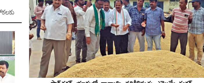
షాద్ నగర్ యార్లూర్ ధాన్యాన్ని పరీక్షిస్తున్న ఎమ్మెల్యే శంకర్

మార్కెట్ అభివృద్ధికి రూ.3.89 కోట్లు మంజూరు